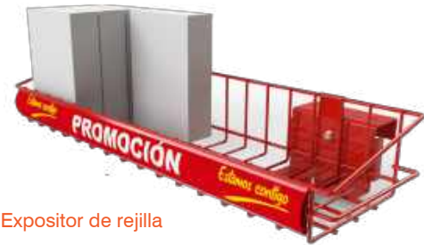
Expositor de rejilla

Aptos para frío positivo, negativo y seco. Disponible modelo con anclaje por ventosas.