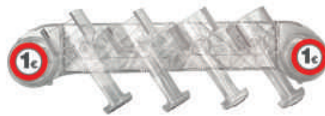
Expositor ApexQuax con ventosa