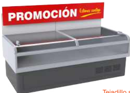
Tejadillo sobre arcón de frío