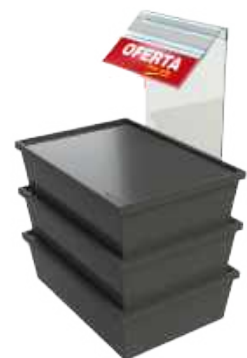
Suplemento sobre porta-precio

materiales medidas aprox. personalización gráfica intercambiable