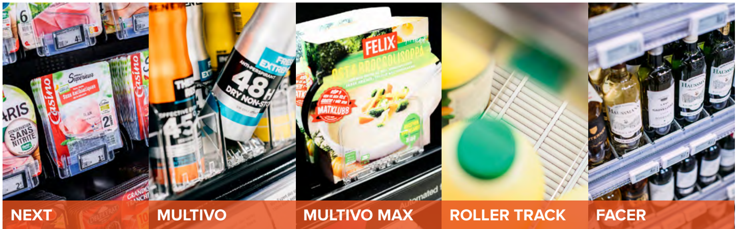
NEXT Sistema de empujador sin balda.